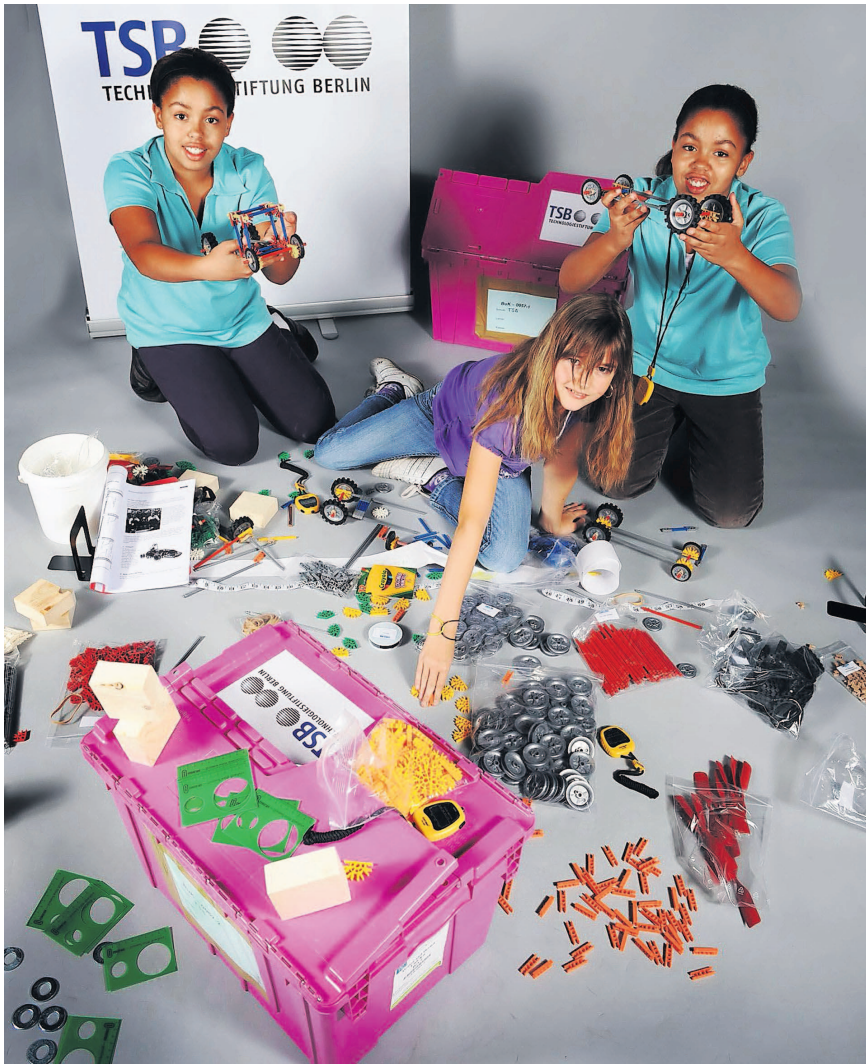
Lernpaket zum Anfassen. Die Unterrichtseinheit „Bewegung und Konstruktion“, mit der die Mädchen hier spielen, besteht aus zwei Kisten. Darin befinden sich die Materialien für elf Teams.

Kann man bei diesen naturwissenschaftlich-technischen Wissen erweitern und muss man das? Muss wirklich jeder Berliner wissen, wie ein Computer funktioniert?