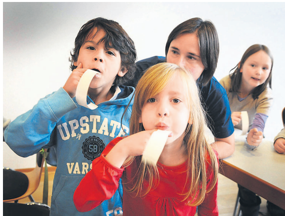
„Wer nicht fragt, bleibt dumm.“ Hier werden Papierschneepel in Bewegung gebracht. Die gleichen Naturgesetze nutzen Ingenieure, um Flugzeuge fliegen zu lassen. Wer bei den Aktionstagen war, weiß, wie es geht.

Das Ziel der Veranstaltung, Kinder zu begeistern und zu faszinieren, wurde im wahrsten Sinne des Wortes spielend erreicht. Damit das kein einmaliges Erlebnis bleibt, erhielten alle Schülerinnen und Schüler ein Experi-